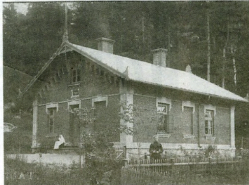
■"Wilhema", kurā darbojās Līgatnes papīrfabrikas slimokases bibliotēka.

70., 80. gados bibliotēkas darbs spīgti redzami tā laika ideoloģiskie uzdevumi. Sociālistiskajā sacensībā katrai iestādei bija sevi jāparāda. Šodien ar smaidu var lasīt sociālistiskās saistības 1983.gadam, ka Līgatnes "bibliotēka apņemas palielināt lasītāju skaitu par 15, izsniegtu par 800, padziļināt darbu ar grupu jaunies dabas draugi, izveidot grāmatu nosaukumu kartotēku, papildināt novadpētniecības mapi, celt profesionālo un izglītības līmeni". Sociālistiskajā sacensībā līgatniešiem vienīgi konkurenti bija