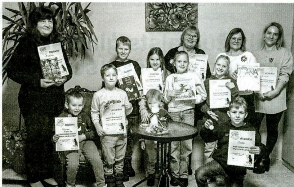
Latvijas valsts svētkiem veltītā skalās lasīšanas konkursa dalībnieki Puikules bibliotēkā

Konkurss pulcēja sešus bērnus un piecus pieaugušos. Katrs pirms pasākuma bija rūpīgi izvēlējis sev tīkamu literāro darbu un sagatavojis 2–3 minūšu lasījumu. Dzirdētie lasījumi aptvēra plašu tēmu loku – no nozīmīgiem vēstures notikumiem līdz pat latviešu tautas teikām. Skanēja arī