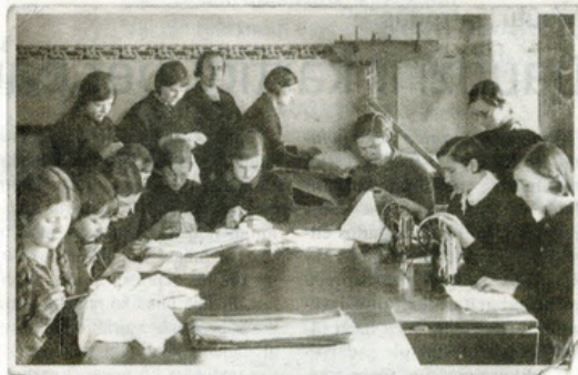
Padures lauksaimniecības skola, rokdarbu stunda. 1931. gads.

Latvijas bibliotēkas nodarbojas arī ar novadpētniecību un regulāri papildina savu datu bāzi, kurā iekļautas fotogrāfijas un raksti no periodiskajiem izdevumiem. Kuldīgas novadā – galvenokārt no laikraksta Kurzemnieks un tā priekšgājējiem Padomju Dzimtenes , Padomju Kuldīgas , Jaunā Kurzemnieka , kuru rakstus datu bāzes papildināšanai drīkst izmantot bez maksas. Bez atbildības var izmantot arī tā sauktos bāretrakstus no citiem izdevumiem, atrodamas vietnē Periodika.lv . Ar agrī bez vecākiem palikušiem cilvēkiem šim nosaukumam gan nav nekāda sakara – tas vienkārti nozīmē Autortiesību datubāzē nenosakāma autortiesību subjekta darbs .