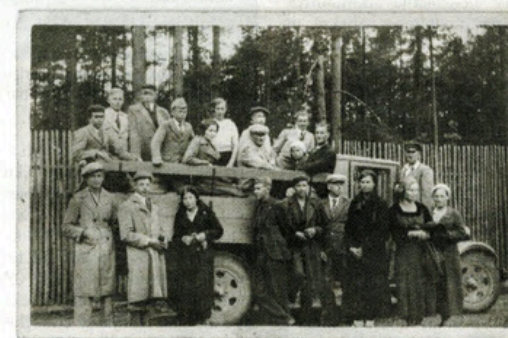
Padures lauksaimniecības skolas pārstāvji pie zoodārza 1939. gadā.

Bibliotēkas tāpat kā muzeji, arhīvi un līdzīgas iestādes uzskatāmas par atmiņu institūcijām, kas cenšas vēsturiskos fotoattēlus iegūt galvenokārt no iedzīvotājiem, kuri gan ne vienmēr ir gatavi ar dzimtas fotogrāfijām dalīties. „Tomēr nevienam nevajadzētu kautrēties to darīt,“ iedrošina Sigitas, „jo novadpētniecības mērķis ir ļoti cēls – padarīt šos materiālus pieejamus arī nākamajām paaudzēm. Tā ir normāla prakse, lai netaisītu, ka tās pat ir mūsu katra tiesības un pienākums. Varbūt ne vienmēr kvalitatīvās bildītes parāda to, kāds pagasts izskatījies agrāk, kuras bija tieši šim pagastam nozīmīgākās personas un notikumi. Bibliotēkai svarīgs viss, kas noticis konkrētajā vietā. Pašam albuma īpašniekam senās fotogrāfijas varbūt nelielas interesantas, bet no kultūrvēstures viedokļa tās ir ļoti vērtīgas. Veidojot virtuālo izstādi, tās tiek korekti apstrādātas, norādot arī visas atsaucis. Ļauzu stāsti ir burvīgi jau paši par sevi, bet vēl brīnīgāk ir tad, ja tos ilustrē attēli. Kāds kungs stāstīja, kā reiz Padurē ziemās visi draudzīgi