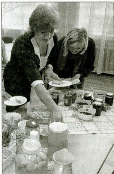
9. oktobrī Kalniešu pagasta bibliotēkā norisinājās pasākums «Mana brīnišķīgā burciņa», kurā bija

aicināti piedalīties visi interesenti. Ieejas biļete bija burciņa ar pašgatavotiem krājumiem ziemai, kas pasākuma laikā tika nogaršoti.