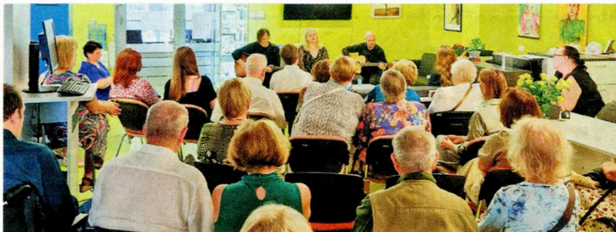
Dzejkoncerts "Savā puķu istabā" Mārupes novada bibliotēkā.