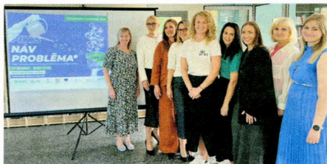
Semināra "Piķis nav problēma" lektori un organizatori.