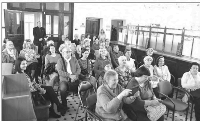
Jēkabpils pilsētas bibliotēkās zālē bija pulcējies kupls skaits interesentu, kas labprāt izzina mūsu pilsētas un tās iedzīvotāju vēsturi.