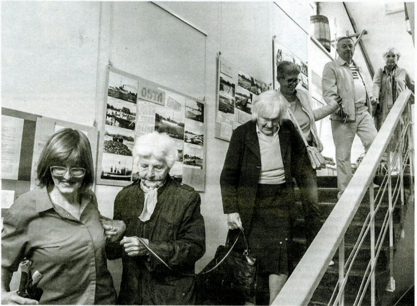
Skatot dziesmai Atmosas Baltija , visi sadevās rokās un izveidoja cilvēku ķēdi, kas veda no Salacgrīvas muzeja telpām līdz bibliotēkai. Dažus rokaspiedienus attālināja Latvijas karoga lentītes