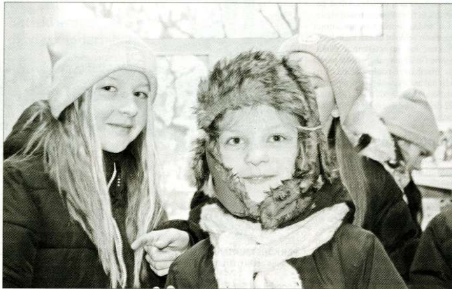
AIZKRAUKLES PAGASTA BIBLIOTĒKAS LASĪTĀJI ir arī pagasta sākumskolas bērni.