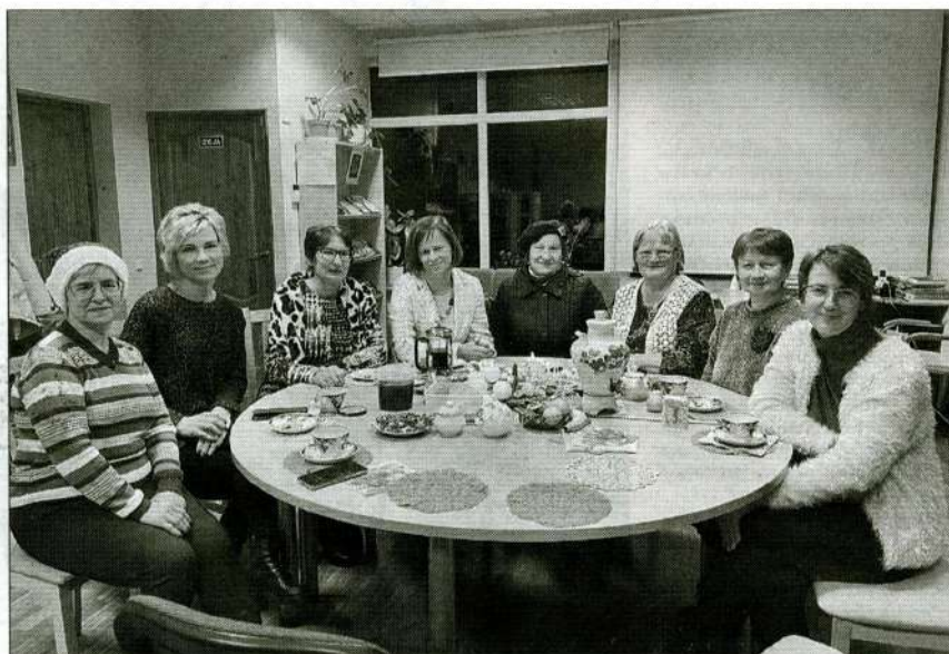
Ar savu stāstu vakarēšanā Lazdonas bibliotēkā piedalās arī interesenti no Madonas un citiem novada pagastiem.

Kā uzsvēr pašas lazdonietes, šādi vakari ir nepieciešami ne vien šī kultūrvēsturiskā mantojuma saglabāšanai, bet arī pašu dalībnieku