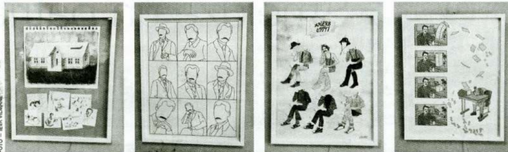
STUDENTU IZSTĀDE PAR ANDREJU UPĪTI Satīku bibliotēkā būs apskatāma līdz 15. janvārim.