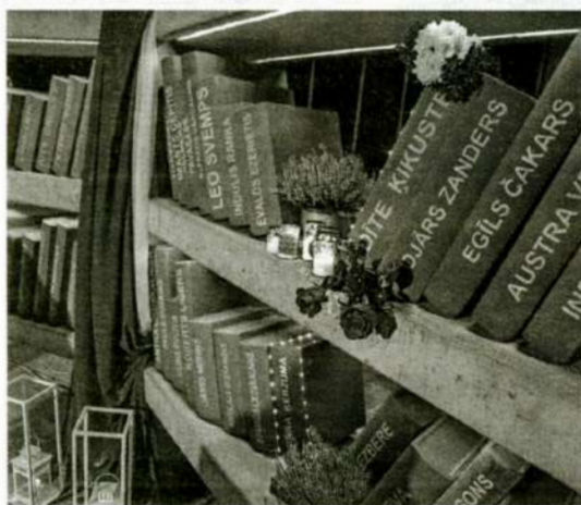
PLAUKTS IR PILNS. "Goda bibliotēka" Gulbenē sasniegusi punktu, kad ne tikai jādodomā, kā šo ideju attīstīt tālāk, bet pašvaldībai ir arī jārikojas.