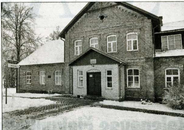
Bibliotēku tīkla reorganizācijas procesa ietvaros iestādes tiek pārsauktas vai reorganizētas, piemēram, Kraukļu bibliotēka tiks pārsaukta par Cesvaines pagasta bibliotēku.

Šobrīd saskaņā ar apstiprinātajiem Madonas novada pašvaldības pagastu pārvalžu nolikumiem bibliotēkas pagastu teritorijās ir pagastu pārvalžu struktūrvienības. Bibliotēku tīkla izmaiņas tiek rosinātas ar mērķi nodrošināt optimālu un efektīvu bibliotēkas pakalpojuma sniegšanu pašvaldības teritorijā. Izmaiņas pašvaldības teritorijā esošajā bibliotēku tīklā tiek veiktas kā iestādes (pagastu pārvaldes) iekšējā reorganizācija — ar 1. decembri vairāku bibliotēku oficiālajā nosaukumā svītrots nosaukums “pagastu pārvaldes