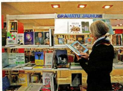
Bibliotēka regulāri papildina krājumu ar jaunākajām grāmatām.

Galvenās bibliotēkas Novadpētniecības sektorā var uzzināt informāciju par Ventspils pilsētu un novadu – vēsturi, ievērojamiem novadniekiem, iestādēm un uzņēmumiem u. c. Interesu loks, par ko