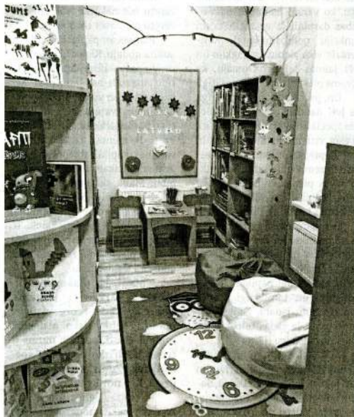
Omulīgais bērnu stūrītis.