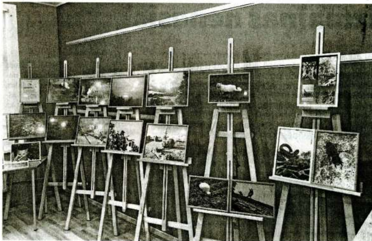
Izstāde «Ar putniem...».

- Viscieņītākā ir daiļliteratūra, un ļoti populāri kļūst latvie-